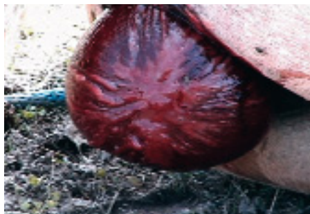
FIGUR 4. Prematur placentaavlossning, "red-bag", förekommer hos ston som ätit vallfoder innehållande specifika endofyttoxiner.

Fölen är ofta överburna, omogna, stora, med svag muskulatur, inkoordination och svag sugreflex. De har vanligen dålig immunitet och är infektionskänsliga med hög morbiditet och mortalitet (12).